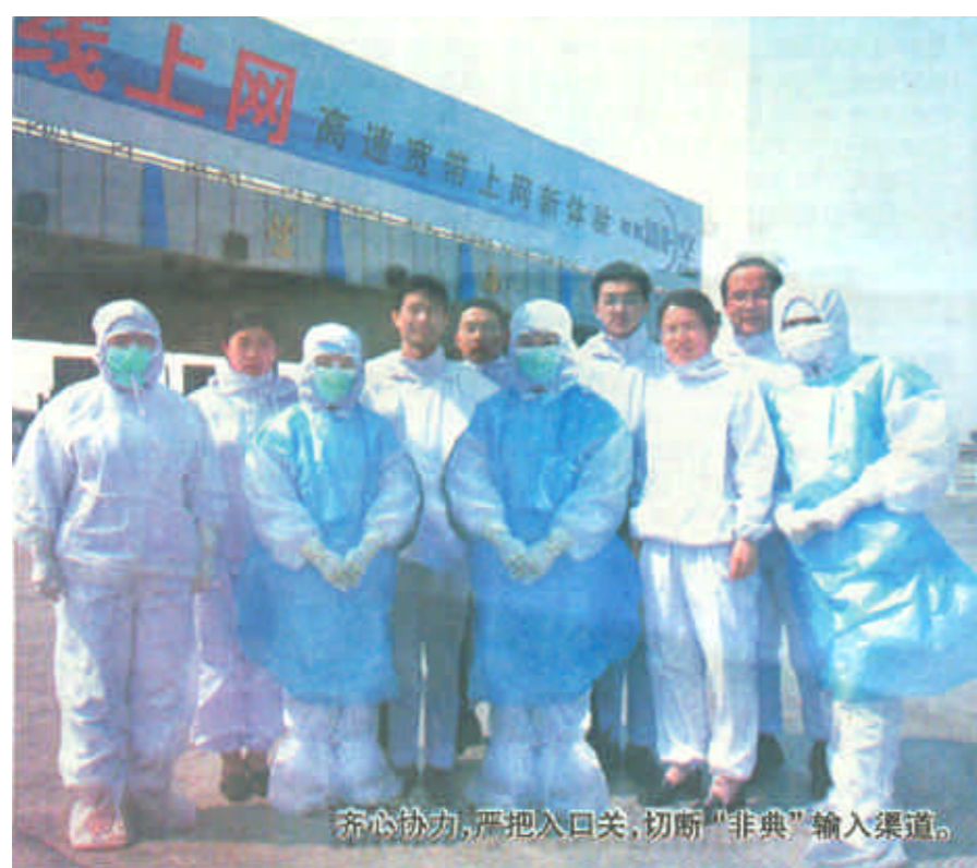
齐心协力,严把入口关,切断“非典”输入渠道。