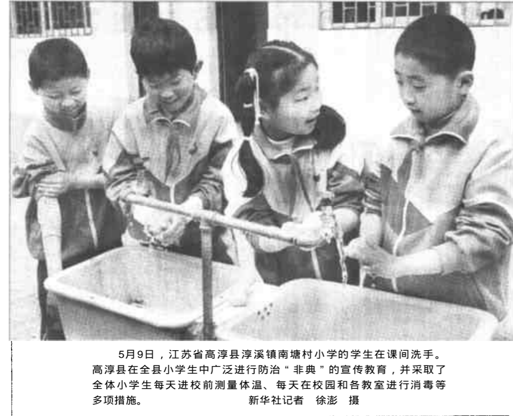
5月9日，江苏省高淳县淳溪镇南塘村小学的学生在课间洗手。高淳县在全县小学生中广泛进行防治“非典”的宣传教育，并采取了全体小学生每天进校前测量体温、每天在校园和各教室进行消毒等多项措施。