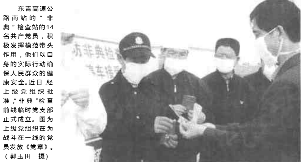
东营高速公路南站的“非典”检查站的14名共产党员，积极发挥模范带头作用，他们以自身的实际行动确保人民群众的健康安全。近日批准“非典”检查前线临时党支部正式成立。图为上级党组织在战斗在一线的党员发放《党章》。