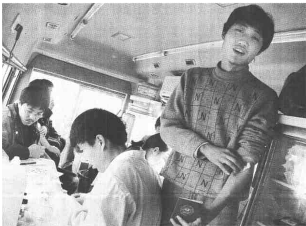
我市广大市民把积极献血作为抗击“非典”的一项实际行动。据了解，现在献血的人数是平时的两倍，仅“五一”期间5天的时间就有200多人参加了献血。目前，市中心血站已储备新鲜血液8万毫升，并增加了一处采血点，以支援北京及保证我市临床用血供应。

提高服务水平。各示范点依托社区和社区服务卫生机构，建立规章制度和辖区残疾人档案，开展了以家庭为基础的康复工作。胜利街道新社区残疾人服务中心组建了40余人的“白衣天使”社区服务志愿者服务队，面向居民开展残疾预防、健康咨询、卫生知识讲座，并与残疾人、老年人结对帮扶，上门为其提供医疗康复训练、日用品配送等项目，使上门服务落到实处。(路英敏)