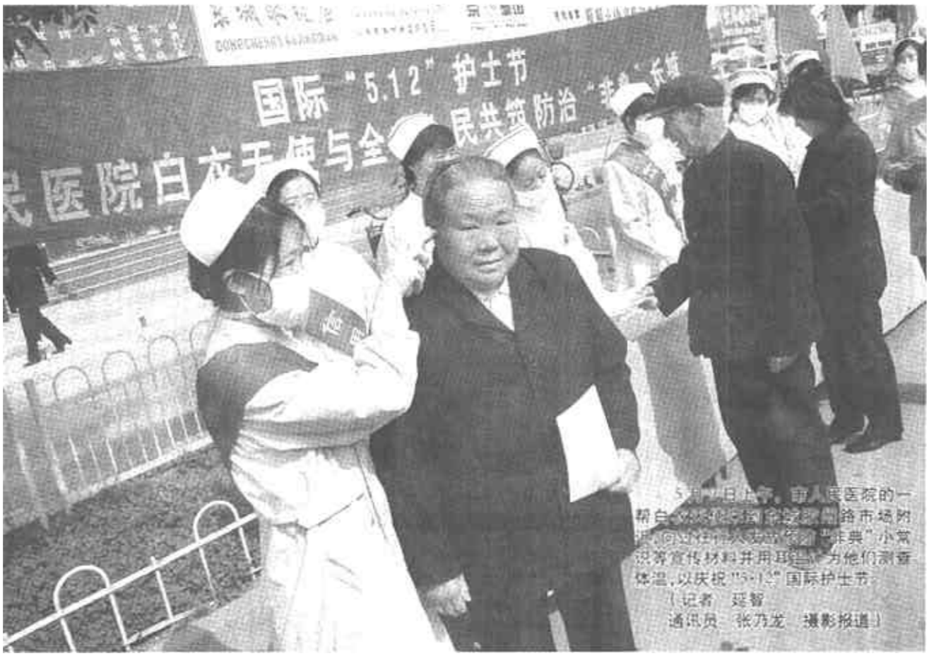
非典时期的普通人

传达党和国家的有关政策精神，拓展帮扶领域，把农民的事情看成是计生委的事情。面对外地出现的“非典”流行，市计生委包村人员一方面对村民做好宣传工作，另一方面引导村民充分发挥计生网络作用做好人员排查，并无偿赠送了过氧乙酸等消毒液和生活保健用品，防治“非典”工作做得有条不紊。 (薄文军 刘宪亮 郭学杰)