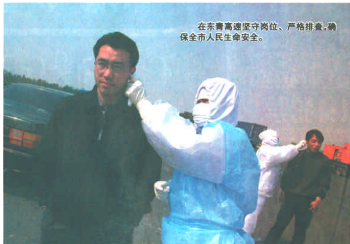
在东营高速坚守岗位、严格排查,确保全市人民生命安全。