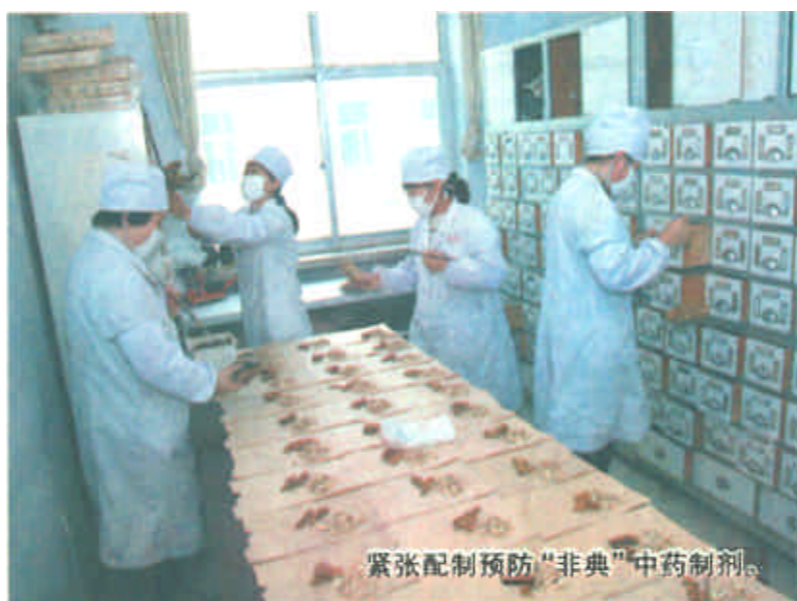
紧张配制预防“非典”中药制剂。