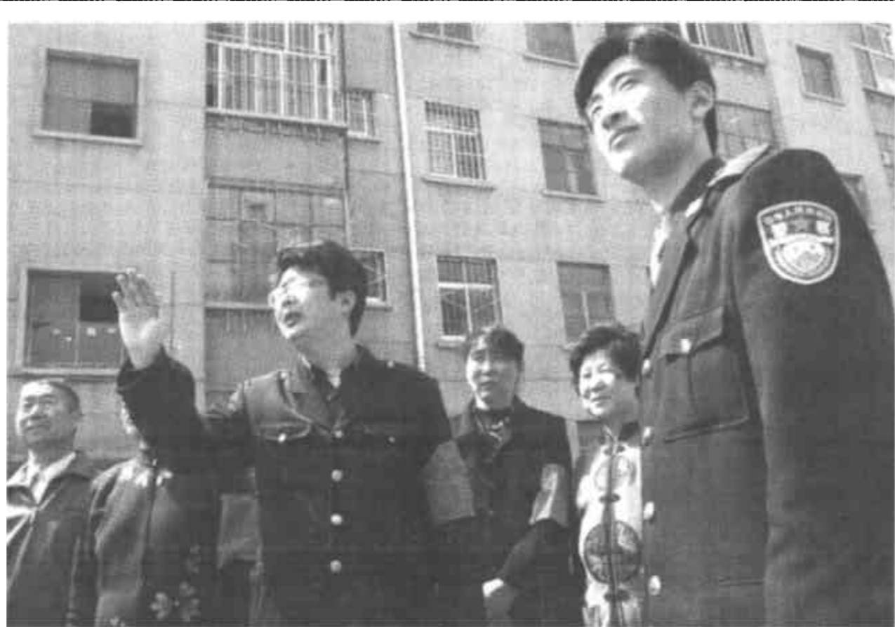
河口区河口街道海宁路居委会100余名退休干部职工主动担任起小区义务安全员，轮流值班巡逻，受到广大居民们的一致好评。

利津县利津镇把实施远距离学生“吃住”工程建设与全镇中学布局调整结合起来，集中财力，分步实施，整体搬迁一中，将在三年内异地新建一所占地182.6亩，建筑面积39444平方米，标准高，规模大，内部设施配套，功能齐全，规范一流的利津镇中学。这是该镇全面完成小学布局调整后，作出的又一项重要举措。 该镇现有的三处中学，布局分散，规模小，标准低，学生“吃住”不便。根据预测，今后生源逐年下降，到2005年全镇共有中学生1680人，35个教学班。为了进一步优化、合理配置教育资源，避免重复建设，提高中学办学效益，实现群体优势和规范办学，创建窗口学校，利津镇党委、政府经过反复研究，决定投资4000万元，对全镇中学布局进行彻底调整。 据悉，目前此项工程的征地勘探、布局规划图、图纸设计已完成，计划本年度内实施的21000平方米的教学、实验、办公、学生宿舍楼和学生餐厅等一期工程将于近期动工。 (王美英 冯华)